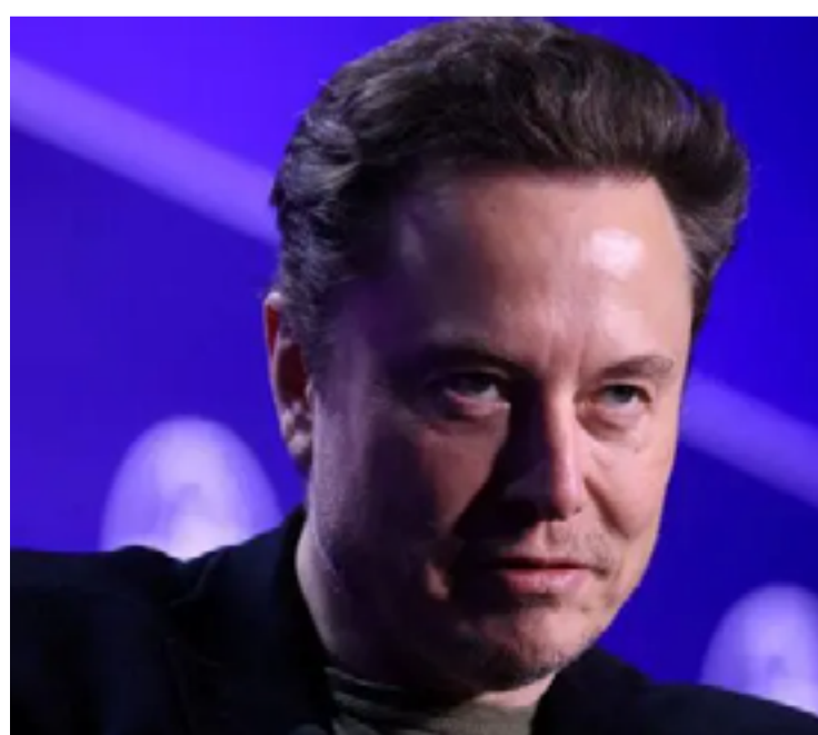
Empresário Elon Musk

Em sua conta, Musk disse que a “decisão de fechar o escritório X no Brasil foi difícil”. “Se tivéssemos concordado com as exigências de censura secreta (ilegal) e entrega de informações privadas de @alexandre, não haveria como explicar nossas ações sem ficarmos envergonhados.” “Não há dúvidas de que Moraes precisa sair. Ter um ‘justiceiro’ que viola a lei repetidamente e flagrantemente não é justiça nenhuma”, afirmou em outra postagem.