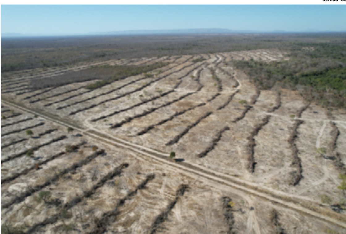
A pronta intervenção das autoridades foi crucial para impedir uma perda ambiental ainda maior

Além do desmatamento, a operação resultou na apreensão de diversas armas, in-