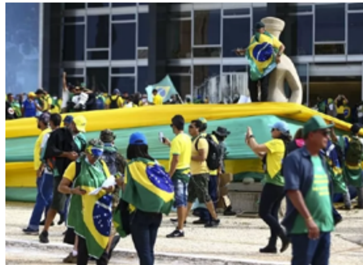
Atos na Praça dos Três Poderes, em Brasília: punição aos golpista