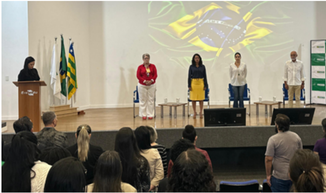
O Seminário proporcionou um dia inteiro de palestras e discussões, reunindo profissionais da saúde e envolvidos na rede de aleitamento materno do Entorno de Goiás e do DF

quando se trata de saúde. Precisamos pensar em parceria entre a Região Metropolitana do Entorno e Brasília. Estamos aqui para garantir que cada unidade tenha a estrutura necessária para operar um banco de leite, um ponto de coleta ou