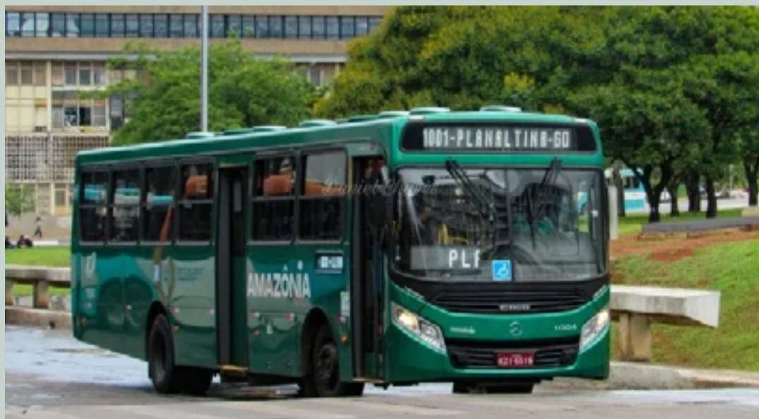
O processo de integração havia sido implementado com o objetivo de facilitar o deslocamento dos moradores entre diferentes regiões do município e para o Distrito Federal.

O processo de integração do transporte público em Planaltina de Goiás, que vinha sendo conduzido pela Amazônia Inter, havia sido implementado com o objetivo de facilitar o deslocamento dos moradores entre diferentes regiões do município e para o Distrito Federal.