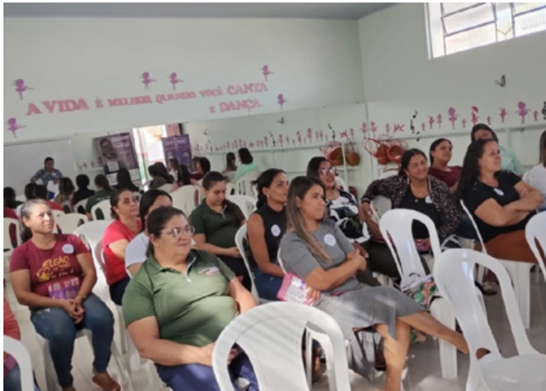
Capacitação é uma das estratégias para redução dos índices de violência contra as mulheres

A luta pela defesa dos direitos das mulheres e também proteção contra atos violentos teve início em Goiás no início da década de 1980, com a criação do Centro de Valorização das Mulheres (Cevam). Criada pela advogada e jornalista