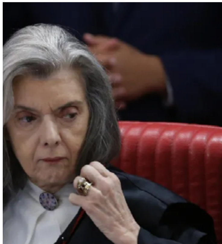
Cármem Lúcia: propaganda eleitoral permite interação de candidato e eleitor