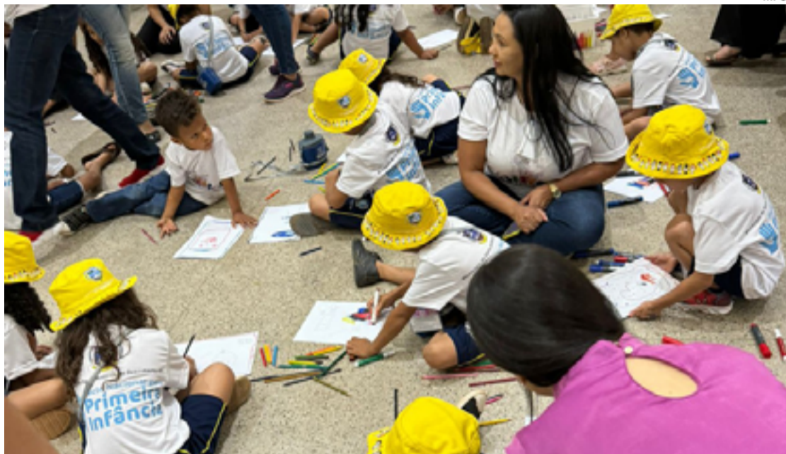
A oficina representa uma iniciativa importante para a conscientização e educação das crianças sobre o papel do Judiciário em suas vidas

Durante a oficina, as crianças, acompanhadas por monitoras, tiveram a oportunidade de visitar o Tribunal do Júri, onde conheceram um pouco da história do fórum e do funcionamento do sistema de Justiça. A visita foi marcada por uma abordagem lúdica e educativa, com atividades que incluíram contação de histórias focadas nos direitos das crianças. As histórias apresentadas não só cativaram os pequenos,