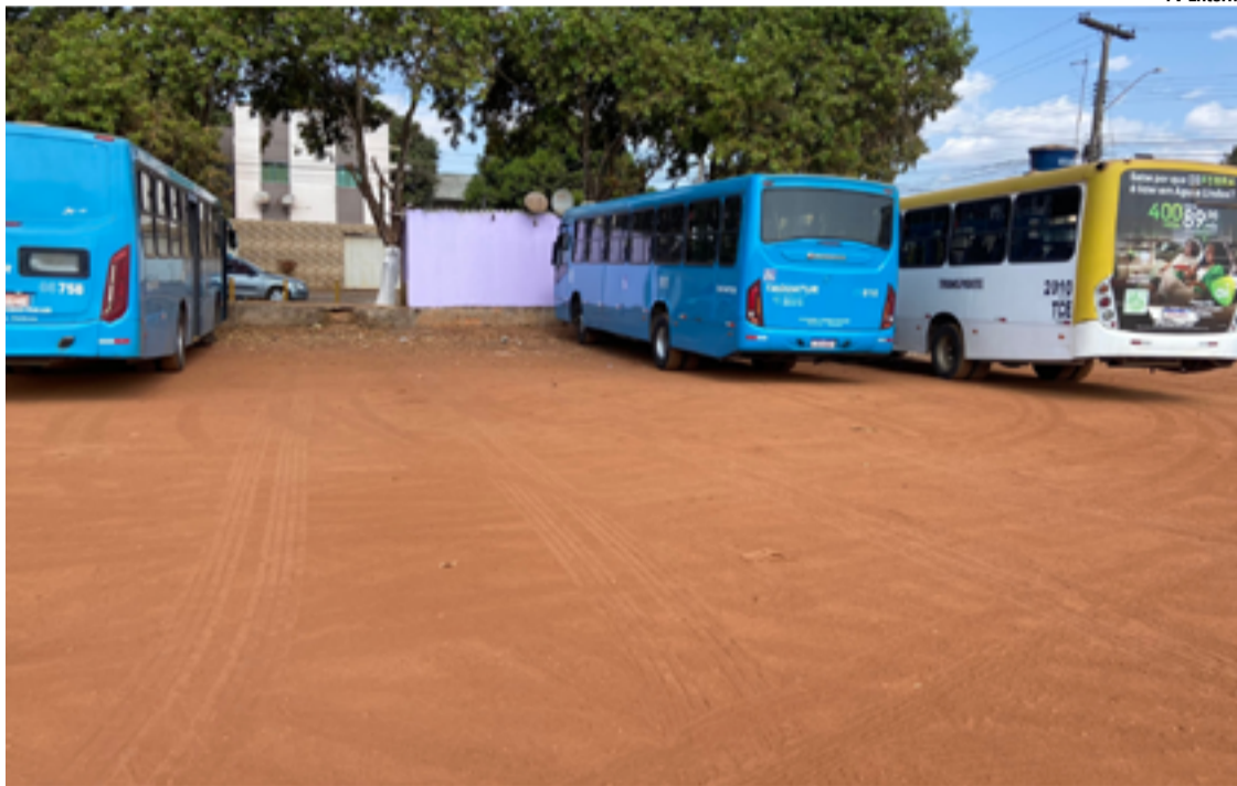
Ônibus que passam pelo terminal enfrentam dificuldades, sacolejando excessivamente devido aos buracos e ao terreno irregular.

Na época das chuvas, a área se transforma em um verdadeiro lamaçal, tornando o tráfego extremamente complicado. Ônibus que passam pelo terminal enfrentam dificuldades, sacolejando excessivamente devido aos buracos e ao terreno irregular. Motoristas de veículos particulares também precisam de muita paciência e habilidade para evitar danos significativos aos seus veículos. A situação se agrava nos períodos de estiagem, quando a lama dá lugar à poeira, que invade os estabelecimentos comerciais próximos e causa desconforto tanto para