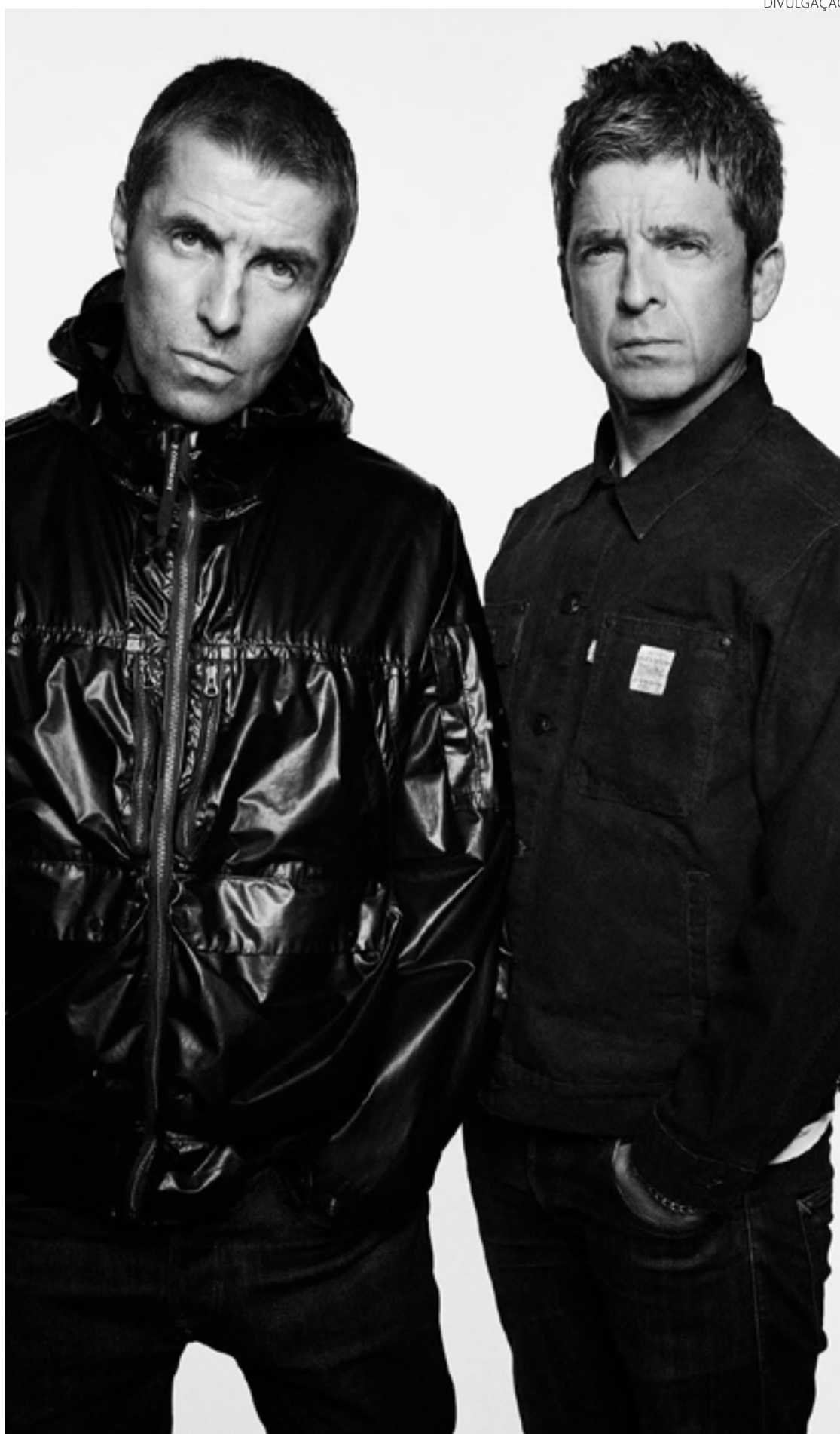
Liam e Noel Gallagher vão excursionar pela primeira vez desde fim da banda, em 2009

A história do Oasis se inicia em 91, com Noel trabalhando como técnico de guitarra para