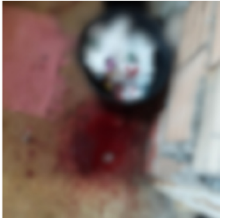
Após o ataque, o agressor fugiu do local, enquanto a vítima foi socorrida por vizinhos e levada ao hospital municipal.

didado foi acatado pela Justiça e, após intensas buscas na cidade, o homem foi encontrado e detido.